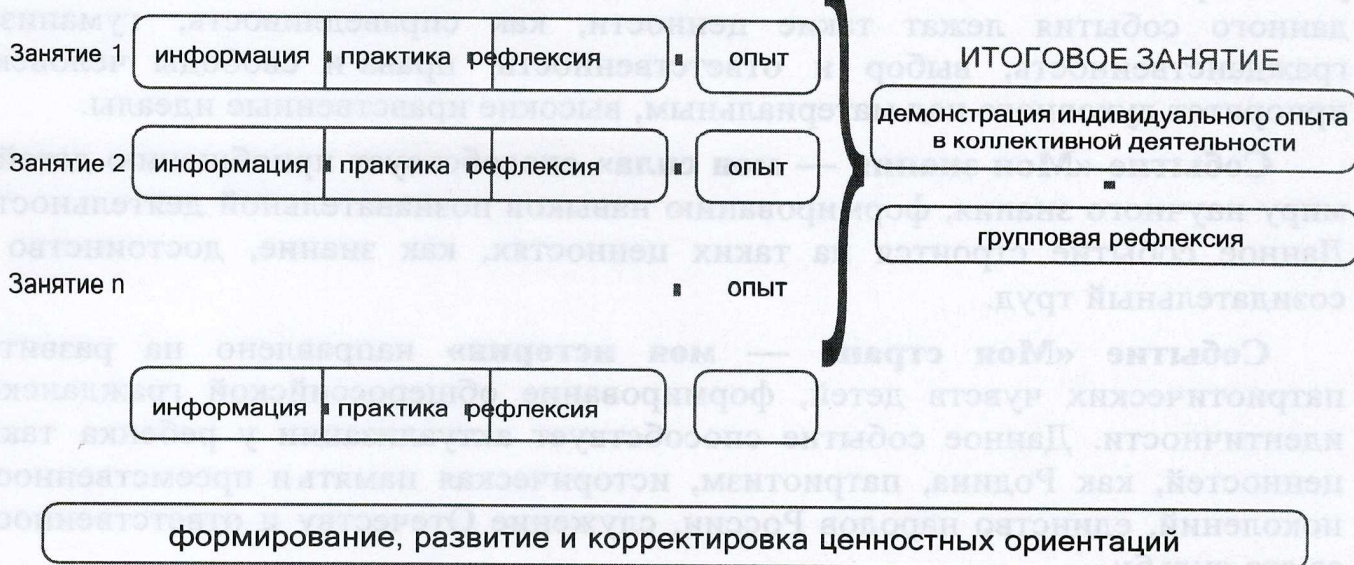
Рисунок 1 — Схема организации события

Таким образом, у пятиклассников происходит построение логической цепочки от собственного опыта проживания каждого занятия к ознакомлению с опытом других детей и к формированию общего отношения классного коллектива к прожитому ими событию.